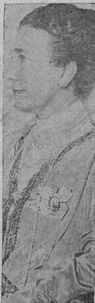
La reina VICTORIA de Suecia que falleció hoy