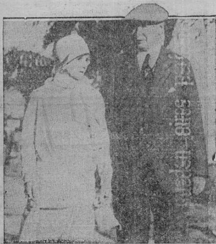
El juez John Weld Peck, a quien vemos con su esposa en San Petersburgo, Florida, es candidato demócrata a la gobernación del Estado de Ohio.