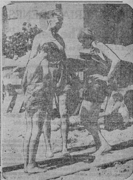
William G. McAdoo, yerno del presidente Wilson, en cuyo gabinete fue ministro de hacienda, aparece con sus familiares en la playa de Waikiki, Honolulu, en sus vacaciones de invierno.