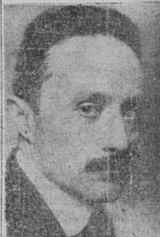
Lic. JOSE VASCONCELOS

A B C se complace nuevamente en poner a los pies de la gentil embajadora el más cordial homenaje de sus admirativos respetos