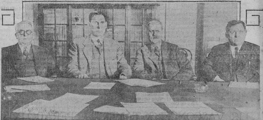
El secretario del interior de los Estados Unidos, Wilbur, aparece aquí con los miembros de la comisión investigadora nombrada por el Senado para conocer de ciertos interesantes asuntos